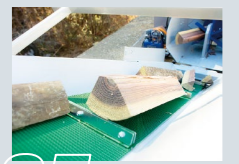
05 薪をコンベアで排出